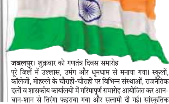
जबलपुर। शुक्रवार को गणतंत्र दिवस समारोह पूरे जिले में उल्लास, उमंग और धूमधाम से मनाया गया। स्कूलों, कॉलेजों, मोहल्ले के चौराहों-चौराहों पर विभिन्न संस्थाओं, राजनैतिक दलों व शासकीय कार्यालयों में गरिमापूर्ण समारोह आयोजित कर आन-बान-शान से तिरंगा फहराया गया और सलामी दी गई। सांस्कृतिक कार्यक्रमों की भी दिन भर धूम रही।